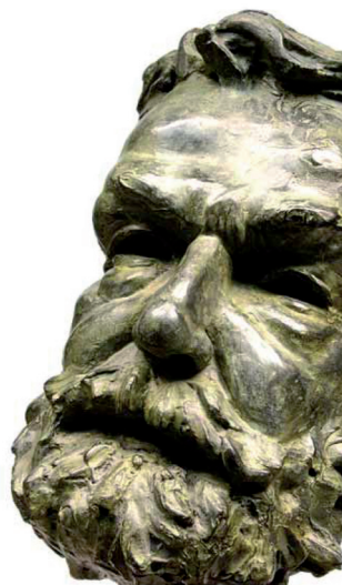
Victor Hugo de Kasper (2007)

Kasper Sculpteur 21, rue Bourdarie Lefure 92600 Asnières-sur-Seine tel : 01 47 91 43 60 www.kasper.fr